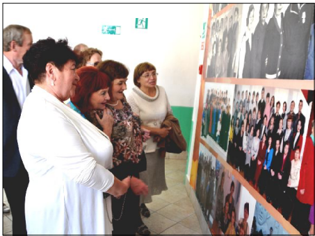
«Они учили нас...»