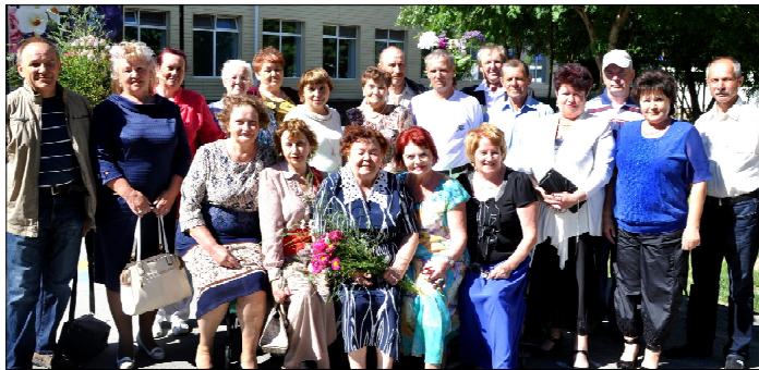
Встреча через 45 лет. Фото на память.