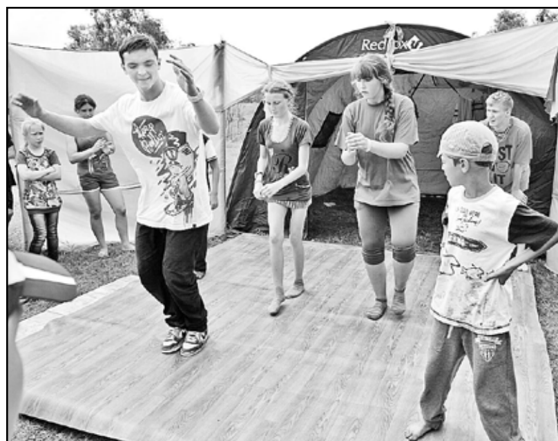
В брейк-дансе главное что? Точность движений, ритмичность, кураж...

Кормили ребят на слёте «Страна чудес» хорошо, пища была вкусной и калорийной. Ели ребята пять раз в день. Неуёмные родители, приезжая в лагерь, дабы посмотреть, как живёт их чадо, подолгу (пожалуй, даже излишне долго и нудно) объясняли, что именно не кушает дома их ребёнок. Одни говорили, что не надо кормить ребёнка молочным, другие поясняли, что не ест их чадо супчик мясной. Только удостоверилась я лично в