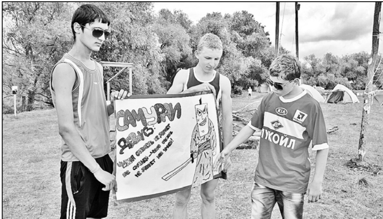
Отряд «Самураи» проводит свою презентацию

слёте приняли участие 64 подростка, с ребятами работали семь преподавателей Казанского центра развития детей.