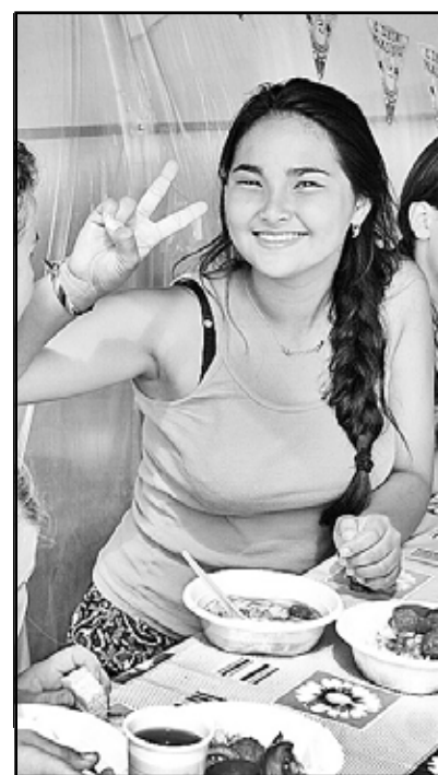
Вкусен боровлянский борщ, и вообще здесь всё здорово!