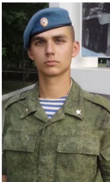
в боевых действиях в Афганистане... Память о том нелёгком времени хранят и фотографии из семейного архива.