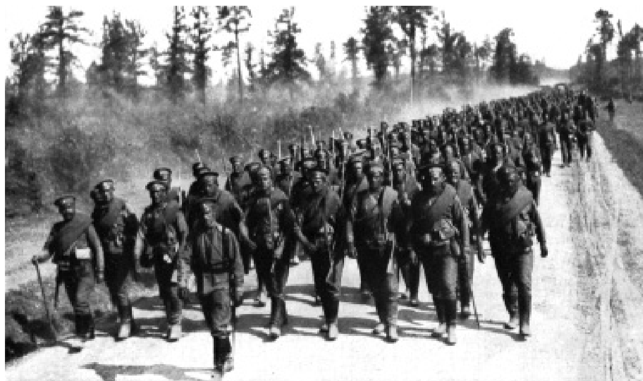
Русская армия на марше