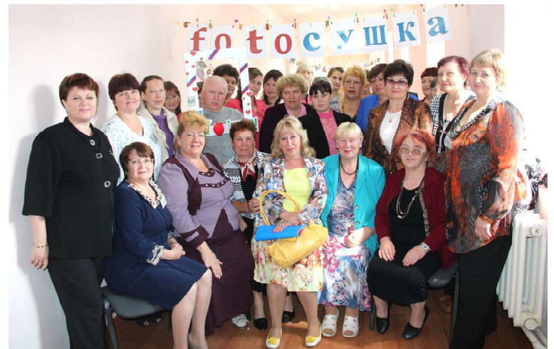
Участники зонального семинара-практикума: «Мы - вместе»

циальной активности инвалидов трудоспособного возраста «Поверь в себя». Специалисты оказывают консультативную помощь по вопросам предоставления мер социальной поддержки, проводят занятия по развитию творческих способностей, индивидуальные и групповые занятия с психологом, досуговые и физкультурно-оздоровительные мероприятия. Для организации эффективного межведомственного взаимодействия в реабилитационных мероприятиях социальным учреждением заключены соглашения о сотрудничестве с отделом культуры, спорта и молодежной политики, районной службой занятости, ГБУЗ ТО «Областная больница №16».