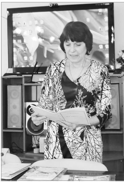
Тихая музыка строк...

Беседа перешла на воспоминания, а те, в свою очередь, - на историю зданий и скверов.