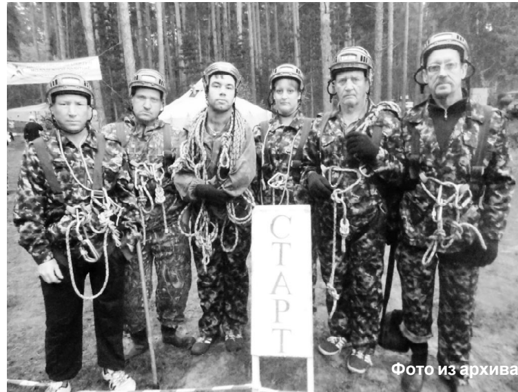
Фото из архива