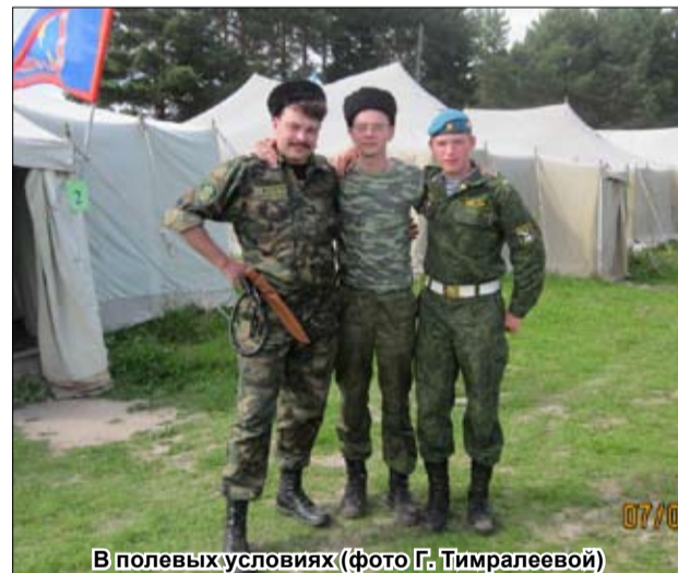
В полевых условиях