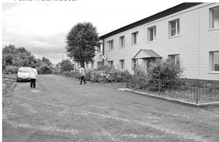
Благоустроенный двор по ул. Ленина (д. №65).