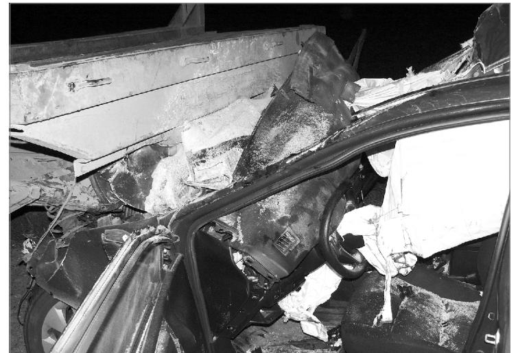
КамАЗ оказался прочнее

Второе ЧП произошло с автомобилем «Тойота Королла», тоже ехавшим с Севера. Иномарка столкнулась с идущим впереди КамАЗом. При ударе стрелка спидометра застыла на скорости 240 км/час. Учи-