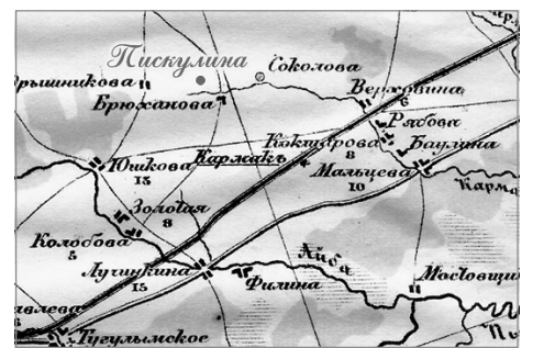
Деревня Пискулина на старой карте