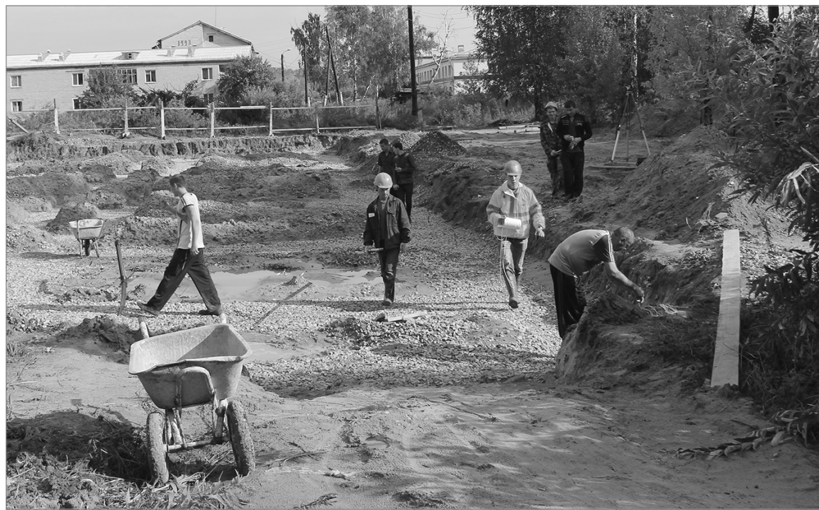
Стройплощадка на ул. Менделеева