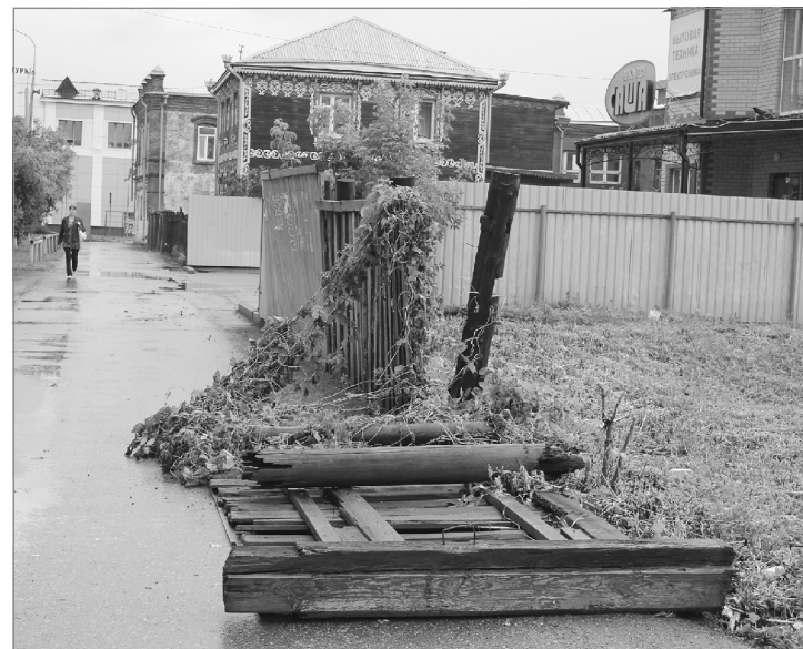
Не устоял под ветром

Жертв и раненых, как сообщают из служб ГО ЧС города и района, нет, сумма ущерба устанавливается.