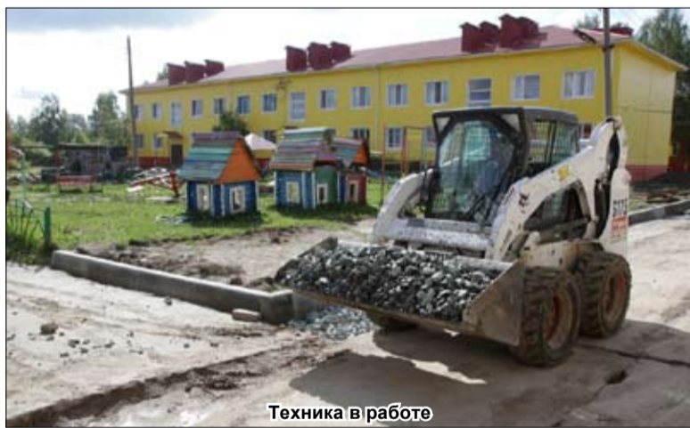
Техника в работе