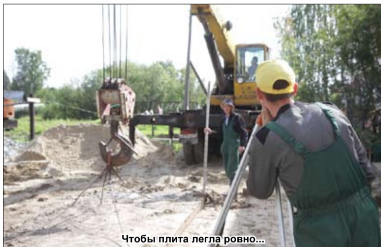
Чтобы плита легла ровно...