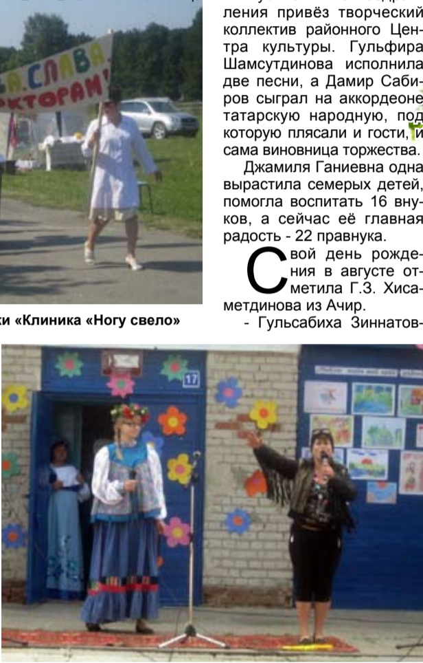
На сцене загваздинские артисты

А днём раньше принимала поздравления жительница