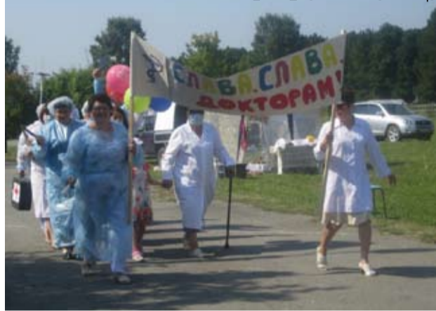
Полуяновские медработники «Клиника «Ногу свело»

днем чествовали первокурсников, новорожденных, старейших жителей, новобранцев и многодетные семьи. Никто не остался без внимания.