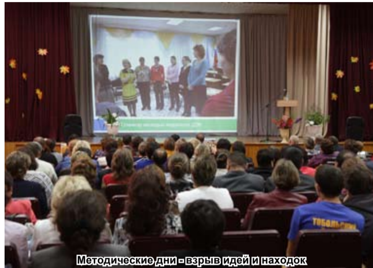
Методические дни - взрыв идей и находок