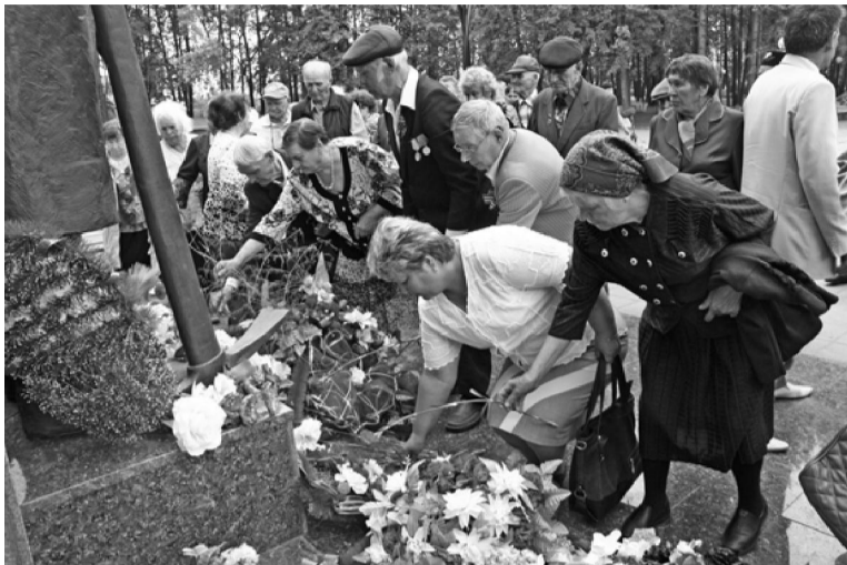
Низкий наш земной поклон...

присутствовало семьдесят человек. Многие не смогли приехать. Да это и понятно, самым молодым сейчас за восемьдесят.