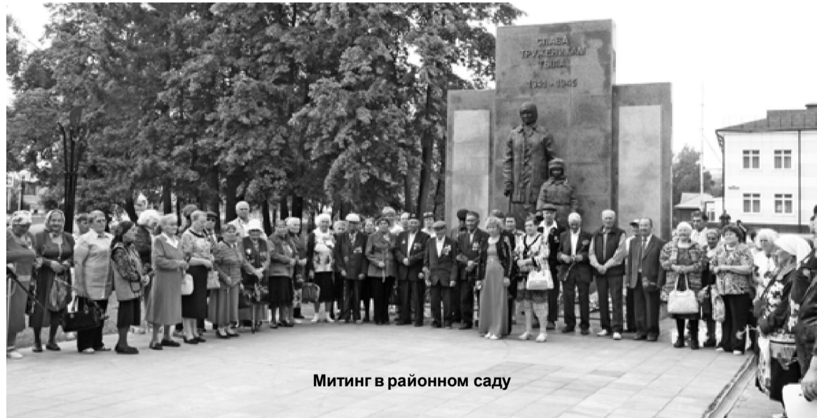
Митинг в районном саду