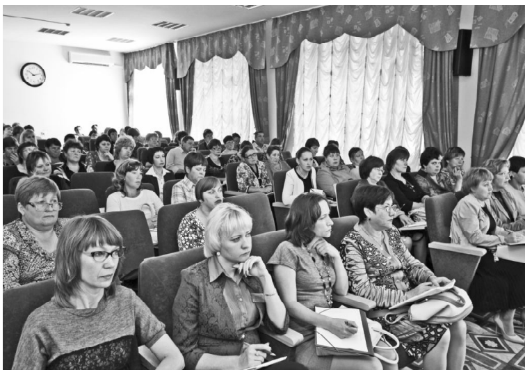
На снимке: на совещании-семинаре в администрации района

Участники совещания получили ответы на интересующие вопросы, обменялись мнениями, получили необходимую документацию.