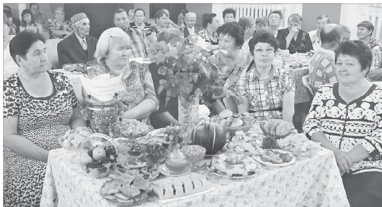
Съехались на праздник ветераны

Пользуясь возможностью, областной парламентарий поделился новостью: из депутатского фонда он выделил средства на