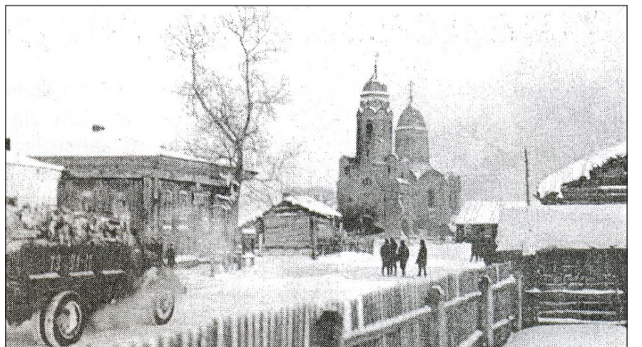
К храму в Малышенке везут дрова, чтобы поджечь опоры под фундаментом