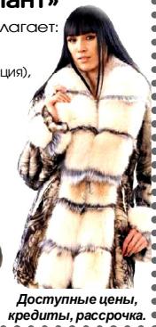
Доступные цены, кредиты, рассрочка.