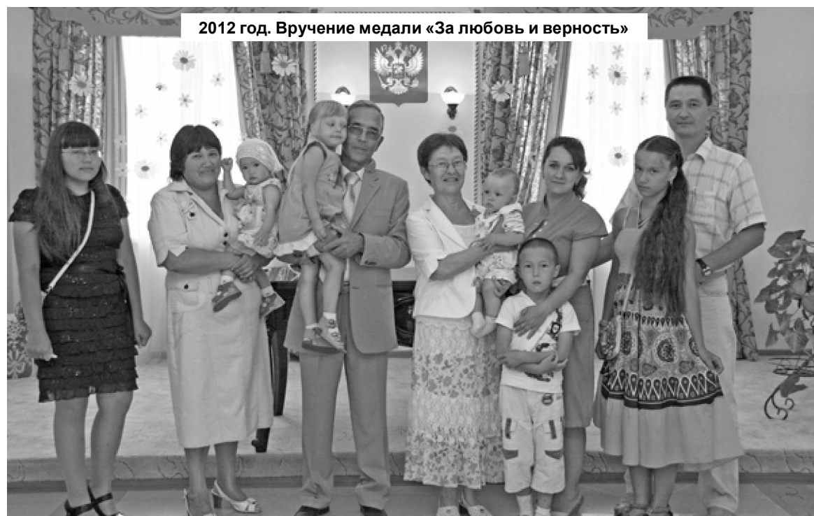
2012 год. Вручение медали «За любовь и верность»