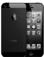
Смартфоны, сотовые телефоны

с. Вагай, ТЦ Южный, 1 этаж ул. Ленина, 16А тел. 23-1-16