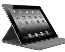
Планшеты с 3G