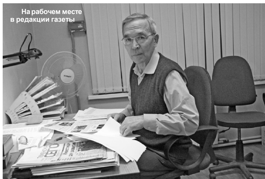
На рабочем месте в редакции газеты

Неоднозначное отношение оставили бурные 90-е годы. С одной стороны, разваливается все, что может развалиться, с другой - только народное образование, вероятно, в силу своей инертности, не только сохранило позиции, более того, продолжает функционировать в режиме развития. Вагайская школа в отделе образования защищает проекты опытно-экспериментальной работы по разным аспектам её деятельности, в том числе по проблемам демократизации учебно-воспитательного процесса, гуманизации образования, управления школой, беззачетного обучения школьников младшего звена и т.д.». А вот что говорят о нем его бывшие коллеги: «Мы всегда вспоминаем жаркие споры, яр-