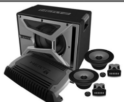
Автомобильные магнитолы, Видеорегистраторы, акустика, сабвуферы.