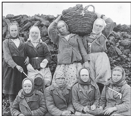
На торфяных разработках