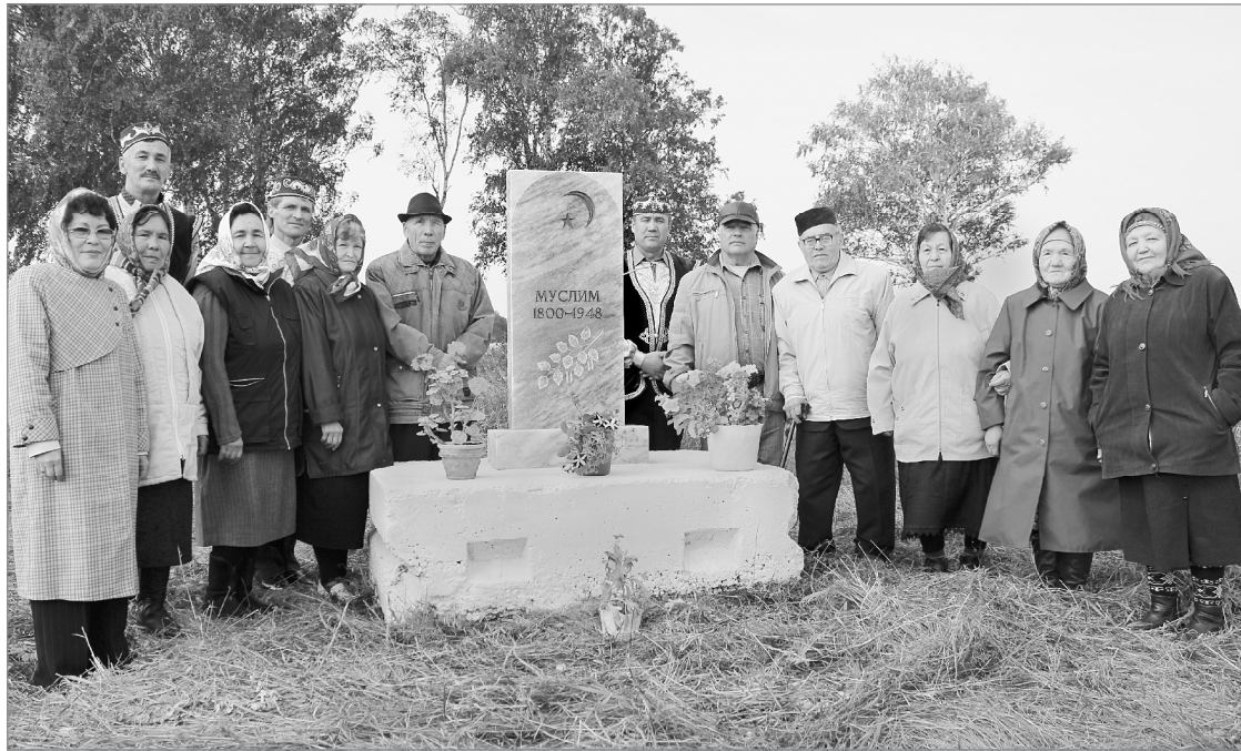
Памятник исчезнувшей д. Муслим появился благодаря жителям Сингульского поселения