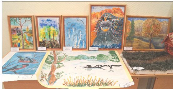
Выставка-конкурс «Мир в твоих руках».