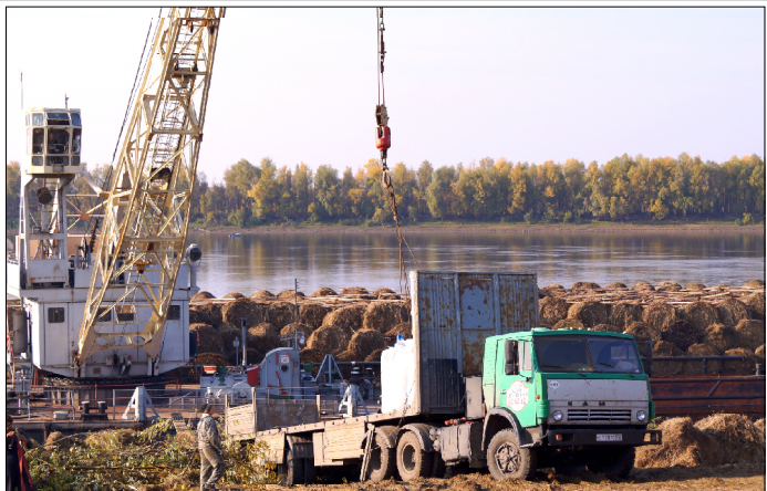
Идут последние часы погрузки сена.