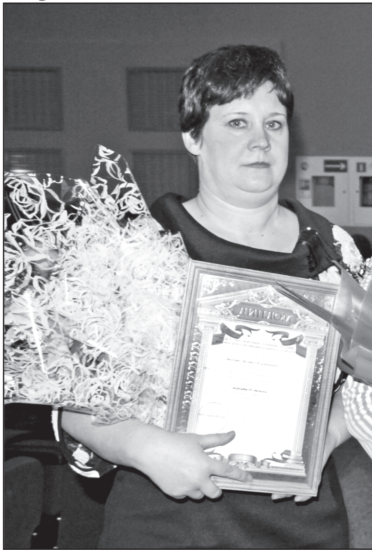
Призёр районного конкурса профессионального мастерства «Педагог года»

– Начинать было сложно, если учесть, что не имела опыта ни преподавательской работы, ни воспитательной, ни административной, – признаётся собеседница. – Позже, когда объединили две