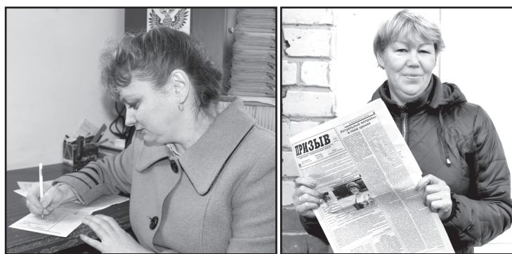
В ОПС Юргинское – 1