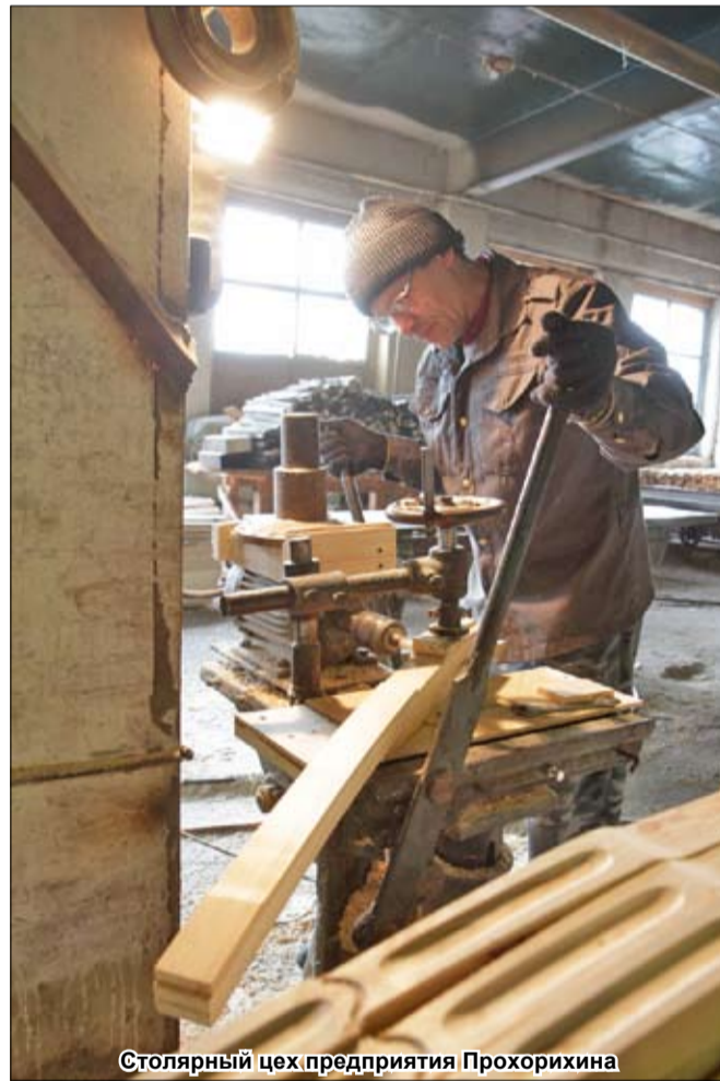
Столярный цех предприятия Прохорихина

Четверг, 9 октября 2014 г. № 81 (7699) Цена 7 руб. 54 коп. Основана в 1962 г. http://www.tyumedia.ru/20/ , http://sovetsib.ru