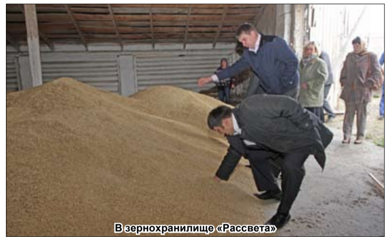
В зернохранилище «Рассвета»