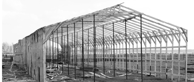
Строится базовое помещение для содержания скота в зимний период