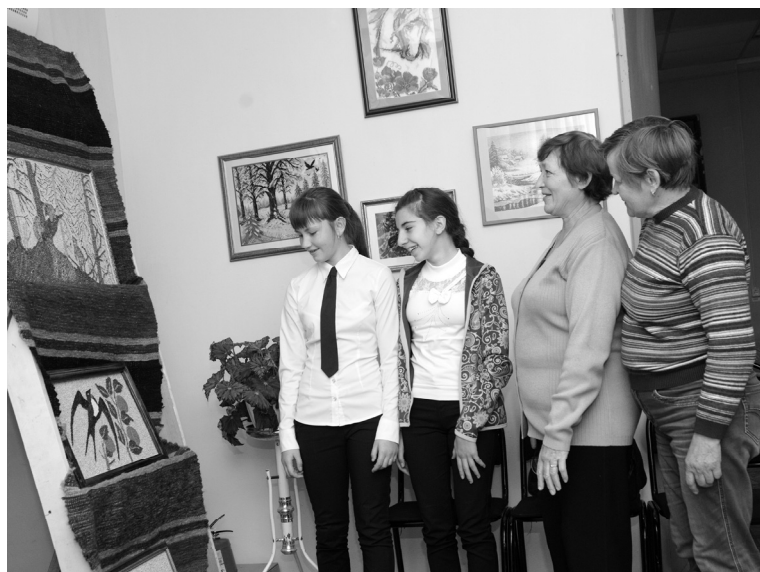
Язык красоты понятен каждому

В сентябре в г.Тюмени прошла областная выставка-продажа изделий прикладного народного творчества, посвященная 70-летию Тюменской области. В ней приняли участие талантливые мастера из 21 района юга Тюменской области и Крыма. Целью выставки-продажи было сохранение традиционной народной культуры, обмен опытом в области современных ремесленных технологий и проведение мастер-классов по народным промыслам.