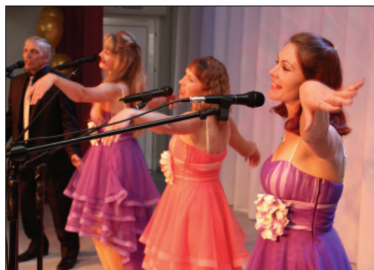
• Ансамбль «А-Ромашка».