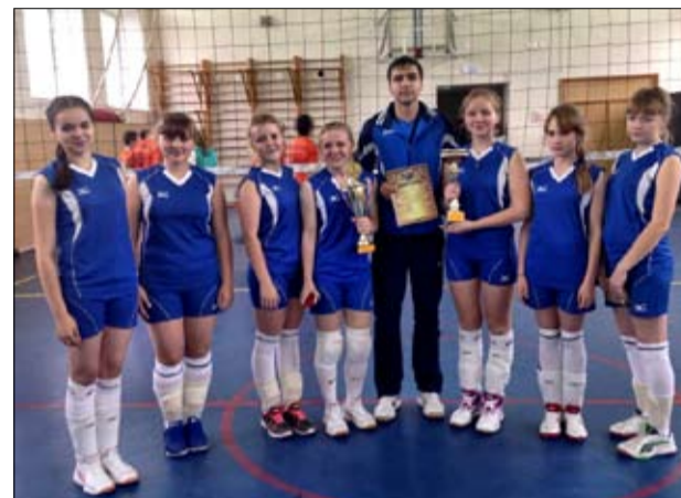
Переходящий кубок увезла команда из Сетово