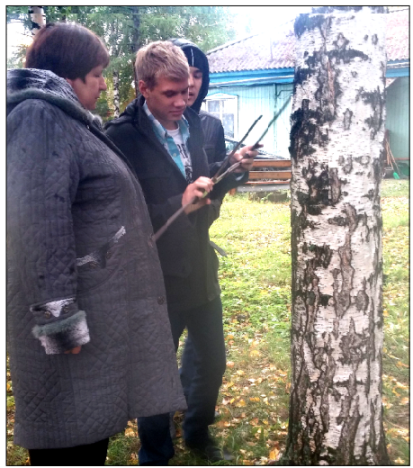
Во время экскурсии школьники научились измерять диаметр ствола дерева.