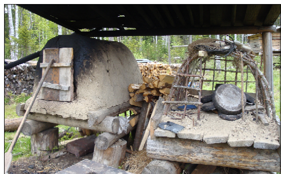
Печи, в которых Усановы пекут хлеб круглый год.