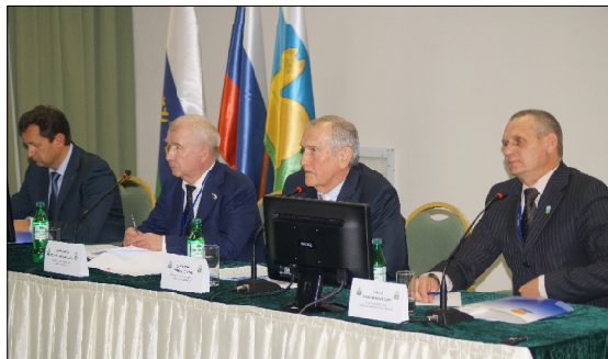
Представители Тюменской областной Думы приняли участие в очередном заседании Думы Уватского муниципального района.

На встрече с депутатами и главами администраций сельских поселений Уватского района гене-