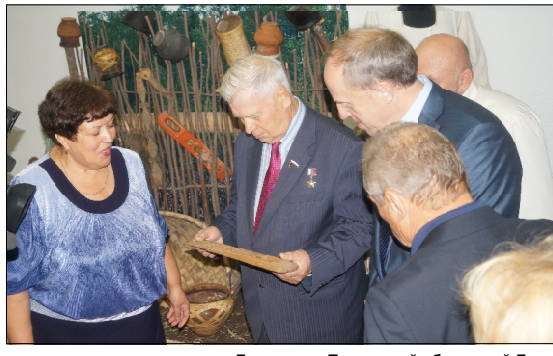
Депутаты Тюменской областной Думы знакомятся с экспонатами Уватского музея.