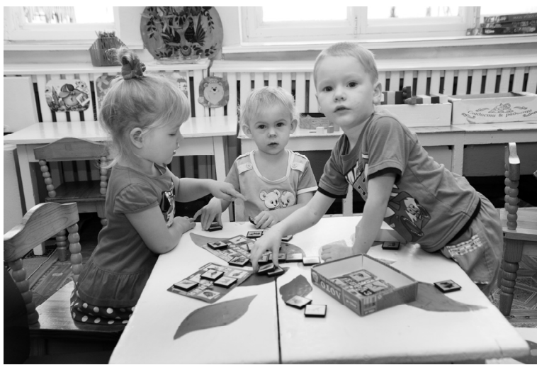
Не мешайте нам никто, мы любители лото

праздник. Дети и взрослые вместе делают поделки из овощей на осеннюю выставку и на новогодний конкурс, участвуют в состязании «Папа, мама, я - спортивная семья». В ходе ежегодной Недели семьи родители организуют для дошколят занятия, веселые старты. Семьи вместе с воспитателями высаживают саженцы деревьев и кустарников. Итогом Недели становится красочная стенгазета