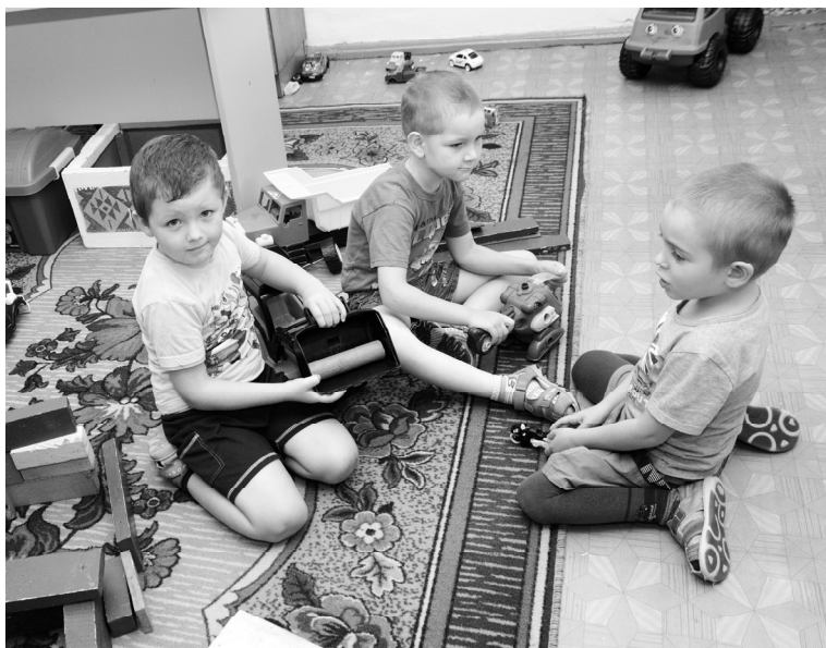
Сончас закончился - по машинам