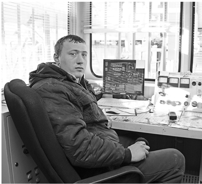
* Всё под контролем

...Мы выходим на территорию. «К такому шуму надо суметь привыкнуть...» – мелькает мысль в голове. И вот в этом шуме, среди витающего запаха рождается асфальт, который затем ровным слоем укрывает наши дороги, чтобы езда по ним была безопасной и лёгкой.