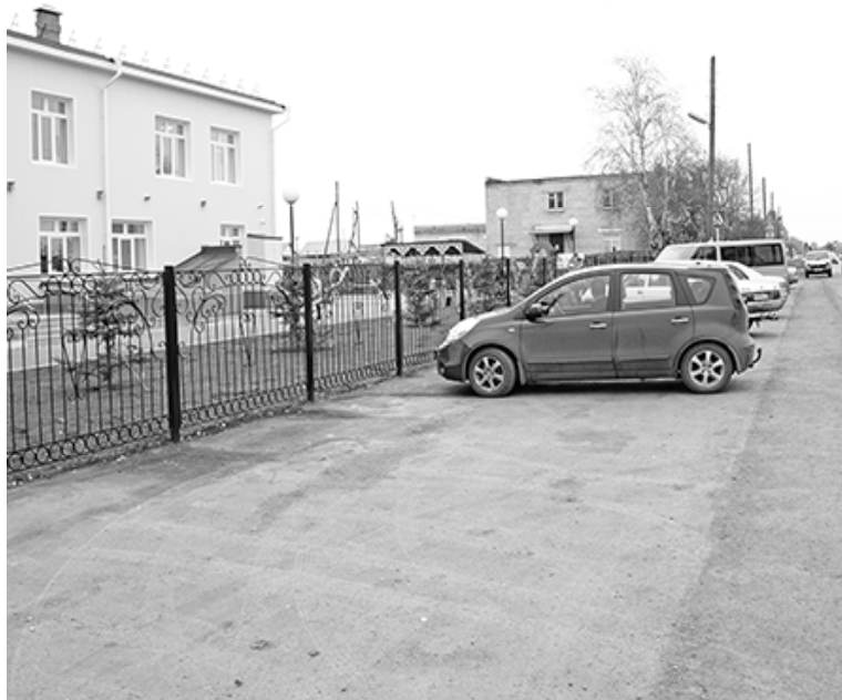
* Возле детского сада «Сказка»