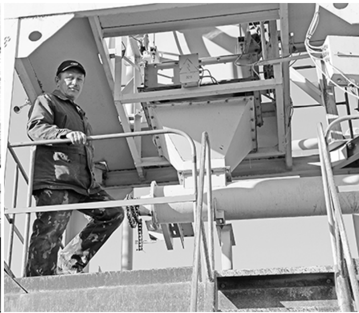
* Здесь варится асфальт...