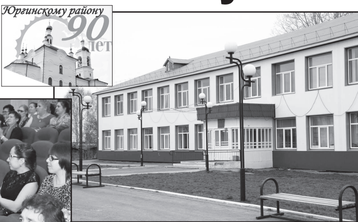
Юргинская средняя школа сегодня