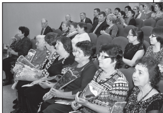
На вечере встречи выпускников