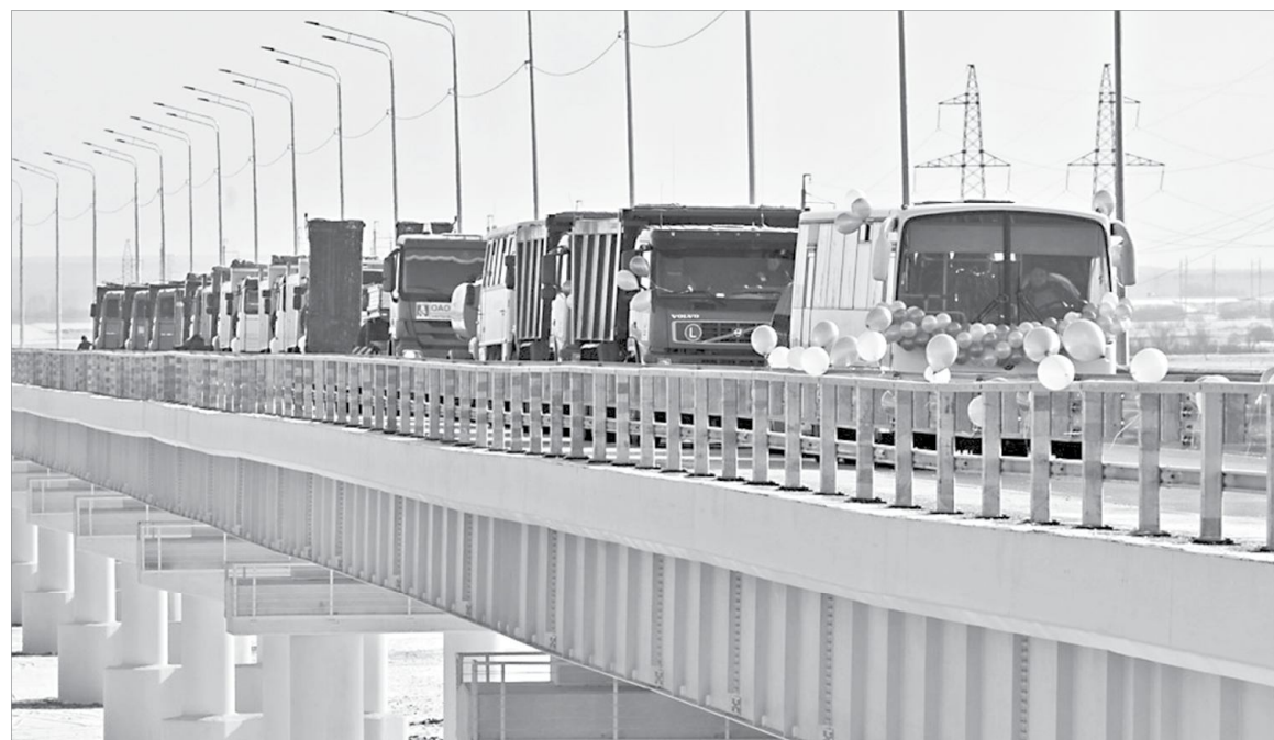
Первый автомобильный караван

Отметим, что новый мост построен рядом со старым. Его реконструкция - следующий этап в работе дорожников. И после выполнения всех поставленных задач здесь будет четырехполосная дорога, это увеличит пропускную способность участка, повысит уровень безопасности дорожного движения.