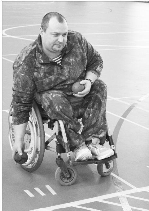
Бочке: опасный момент...

Никого не оставила равнодушными и выставка народных умельцев в рамках проекта районной организации ВОИ «Жить здорово», организованная в фойе спорткомплекса.