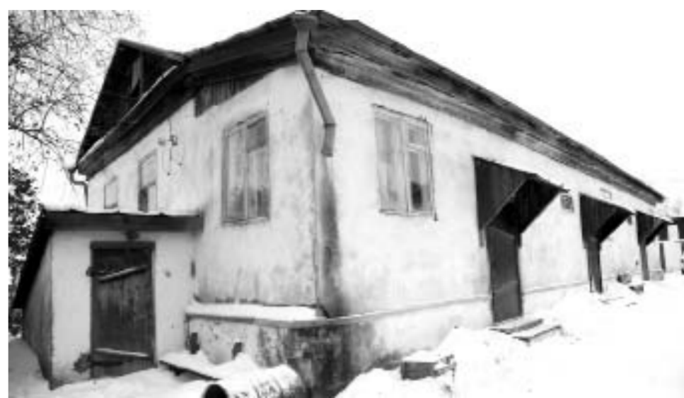
Дом по ул. Большой Сибирской, 17

– Северный полюс манил меня с детских лет, дед