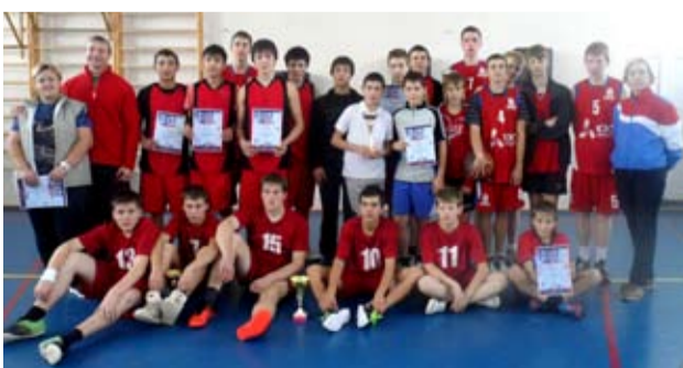
Победители муниципального этапа КЭС-БАСКЕТ

В субботнем состязании приняли участие 49 ребят из восьми общеобразовательных школ. На сей