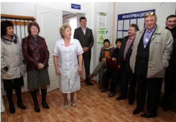
Депутаты в сельской амбулатории

годня обновлён. В наличии 21 трактор от МТЗ различной модификации до К-700, семь зерноуборочных комбайнов, четыре из которых последнего поколения. Здесь немалый автопарк с шестью большегрузными автомобилями «Вольво», четыре автомобиля «КамазЕВРО-24» грузоподъёмностью 25 тонн. В хозяйстве постоянно работает 22 человека, а в период посевной и уборочной кампаний кадровый состав возрастает до пятидесяти. Средняя заработная плата по году составляет до 20