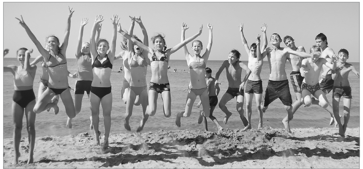
Новые победы у них впереди!

Домой юные спортсмены вернулись счастливые, загорелые, с грамотами и настроен на покорение новых спортивных вершин.