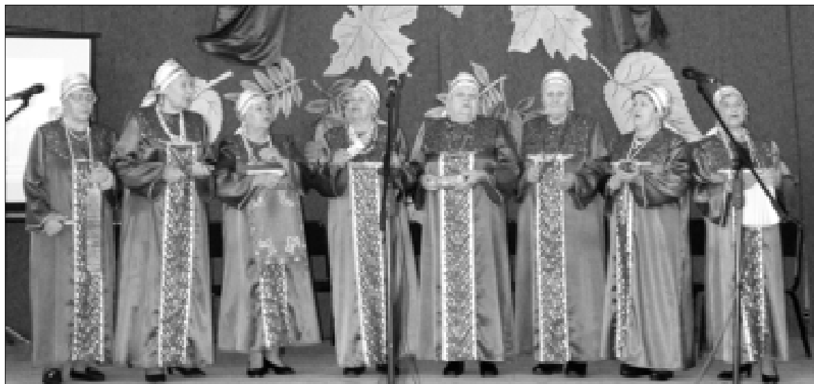
Вокальная группа "Вечерние зори", с. Калмакское