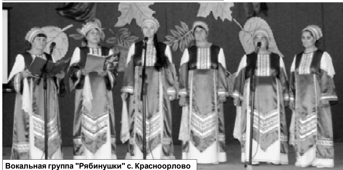
Вокальная группа "Рябинушки" с. Красноорлово