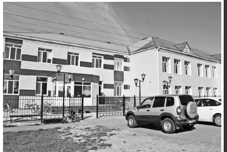
ВСОШ № 1 сегодня