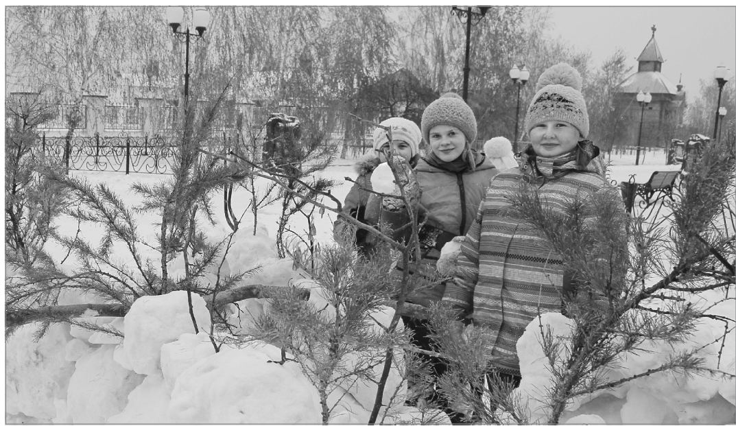
Ещё ноябрь, но рады мы приходу матушки-зимы!