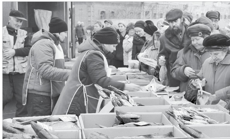
Рыба - королева ярмарки

Лично я могу сказать, что, несмотря на погоду и на небольшое разнообразие продукции, ярмарка удалась. Под жареную картошечку малосольный сырок пошёл замечательно!