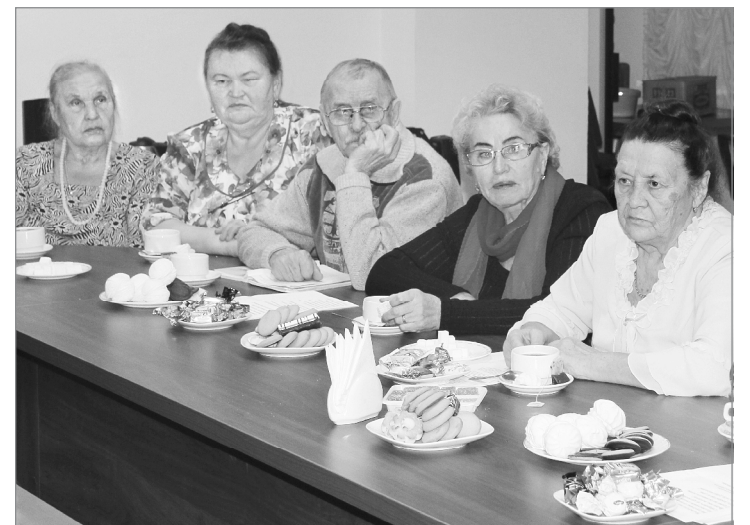
Возраст общению не помеха

Посетив исторические места города и крупные производства, являющиеся визитной карточкой, гости отправились в Нефтеюганск. Они планируют вернуться в Ялуторовск летом, чтобы в полной мере насладиться его красотой.