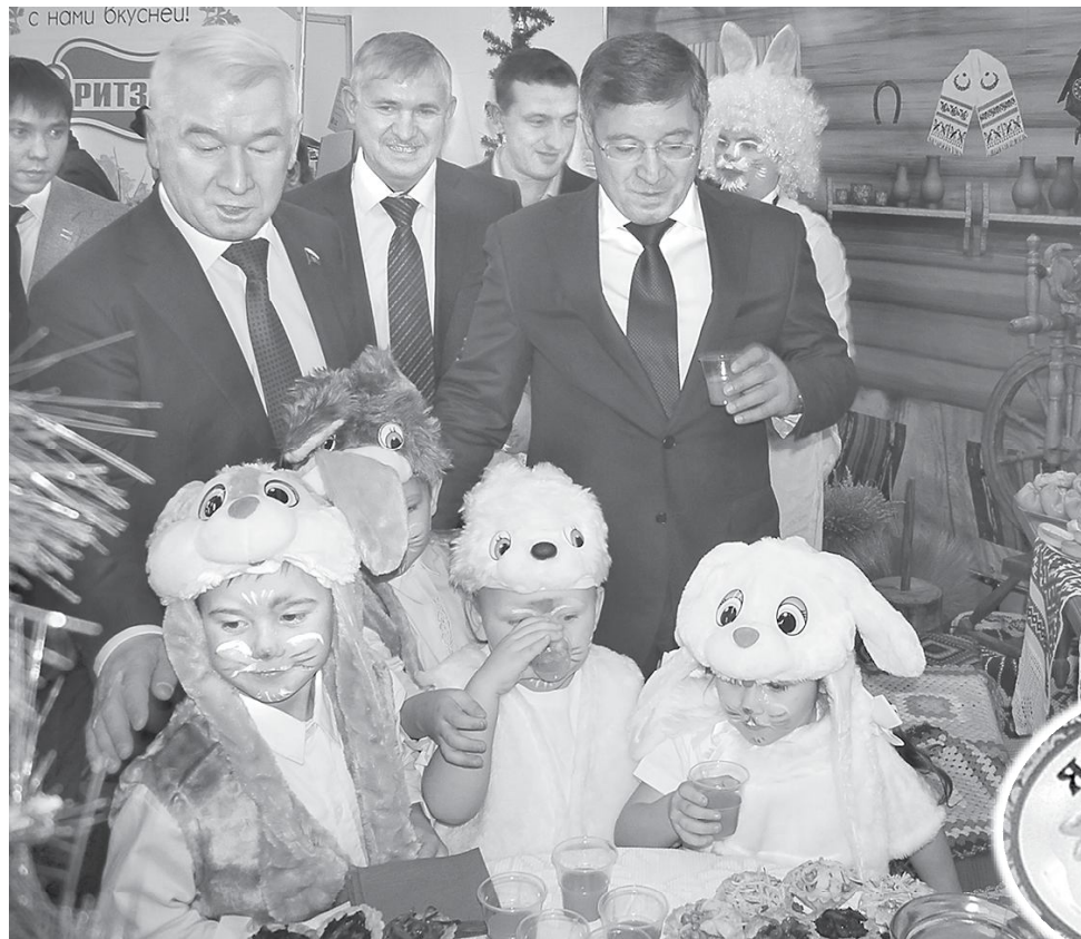
Вкусен и полезен морковный сок!

Татьяна КУРЫНОВА