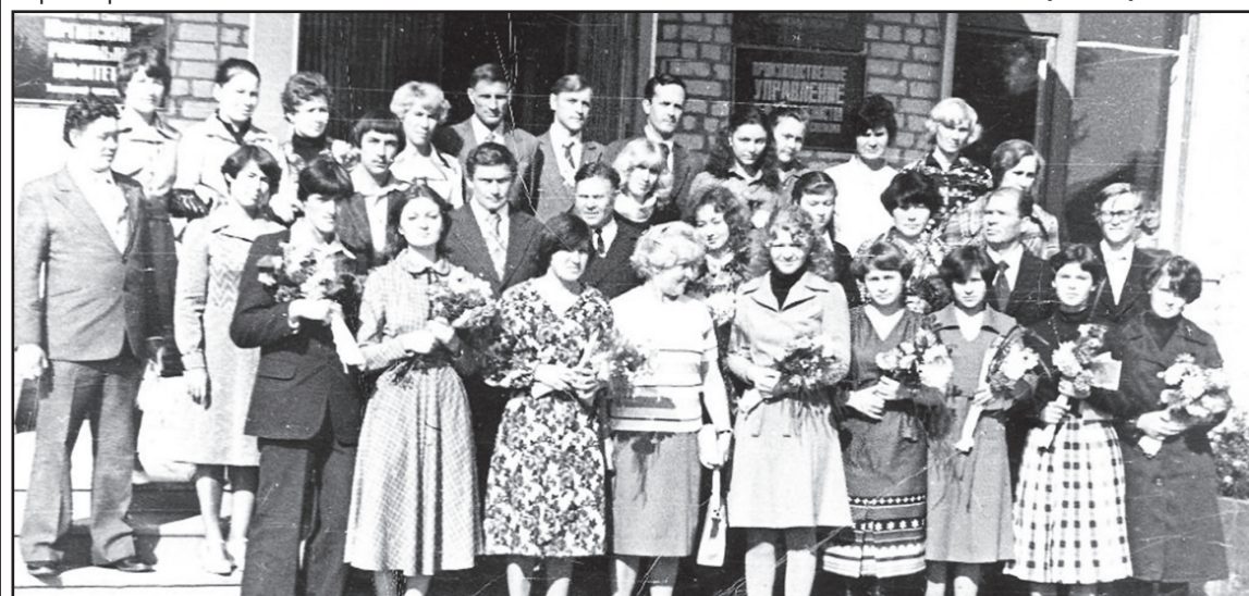
Приём молодых учителей в райкоме КПСС. 1980 г.

По материалам районного музея подготовил А. УСОЛЬЦЕВ