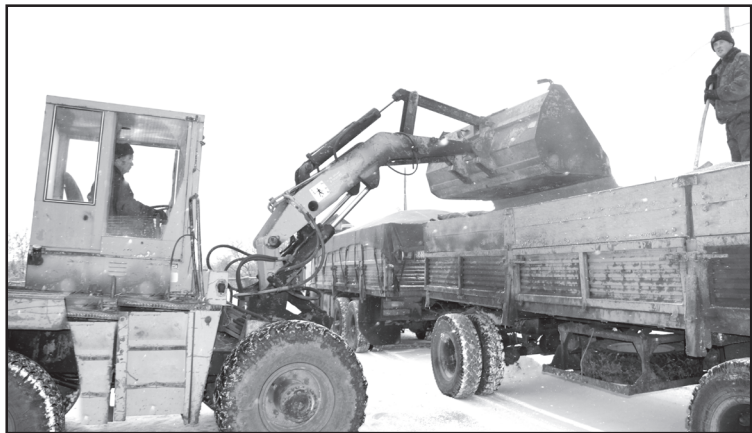
Идёт отгрузка зерна