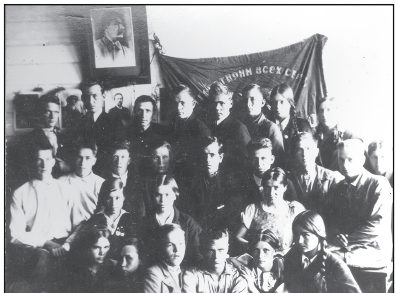
Первый выпуск Юргинской средней школы. 1941 г.