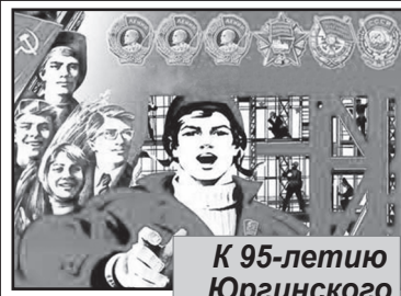
К 95-летию Юргинского комсомола