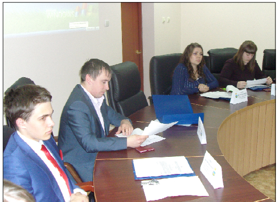
Члены палаты обсуждают темы молодежной политики.