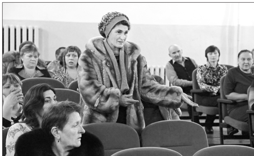
Вопросы обсуждали активно