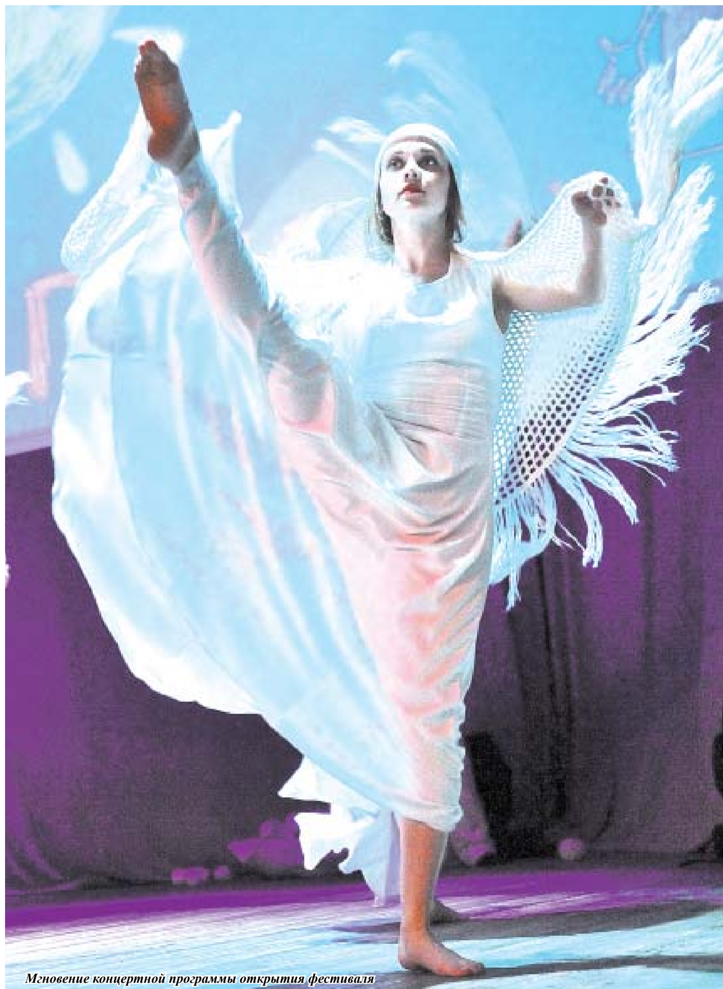
Мгновение концертной программы открытия фестиваля

Тобольск гостеприимно встретил I Международный фестиваль детско-юношеского и семейного кино «Ноль Плюс», организаторами которого выступили Тюменская кинокомпания «Единство», молодёжный центр Союза кинематографистов РФ, Федерация современного искусства и администрация Тобольска.