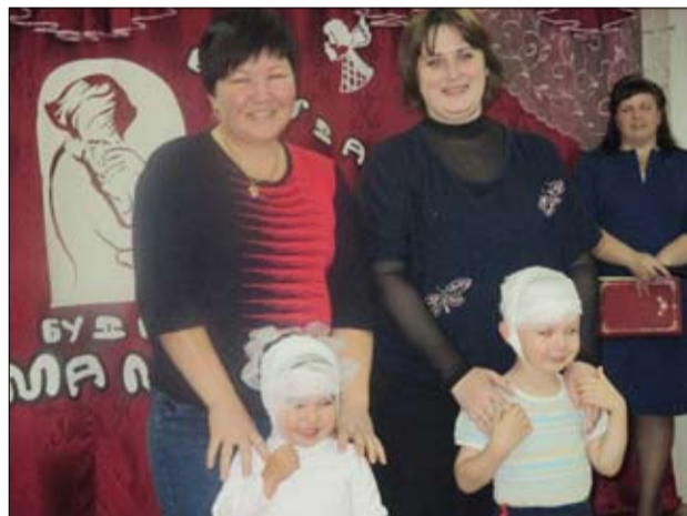
На празднике в детском саду «Берёзка»