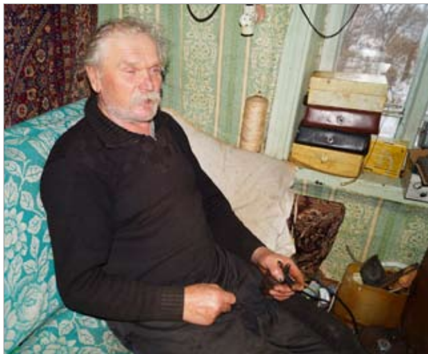
Ф.И. Лопато за очередным изобретением

Запах сена разносился на всю округу, а в воздухе стоял терпкий дымок из печек. Тихая, в снегу заледенелая Чушумова пребы-