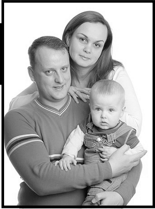
В ДК «Юность» села Каскара состоялся концерт, посвящённый Дню матери: «Пусть всегда будет мама!»