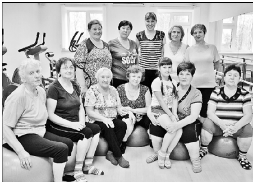
Не угнаться старости за нами

На стадионе «Юность» снова здешку негде упасть. Если летом здесь немного посвободнее, потому как народ казанский в основном занимается садово-огородными делами, то сейчас все решили поправить своё пошатнувшееся за лето в делах праведных здоровье. Для всех категорий населения (начиная с 5-летнего возраста и заканчивая людьми пожилыми) здесь открыты и работают группы здоровья. В одной из них занимаются пенсионеры, люди от работы освобождённые, но молодые духом и энергичные телом.