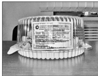
Этот торт не раз менял свой «паспорт»

На месте главного спортивного начальника звание заслуженных спортивных тренеров присвоил бы я продавцам одного из магазинов села Казанского. Работники этого магазина продают народу допинг, который стимулирует организм и толкает его на подвиг. Причём допинг этот «взрачивается» не-