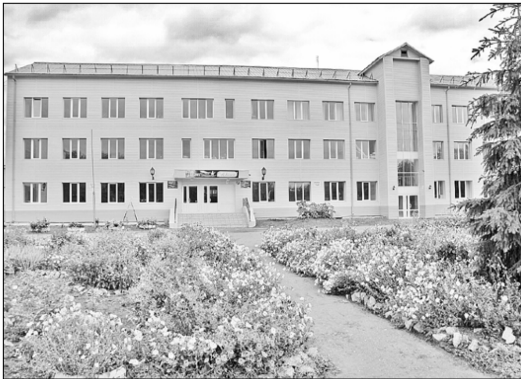
Цветочное царство на территории Казанского училища