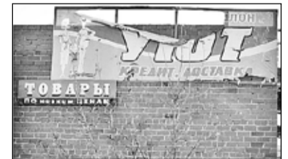
Рекламные полотна по-прежнему наводят страх на людей