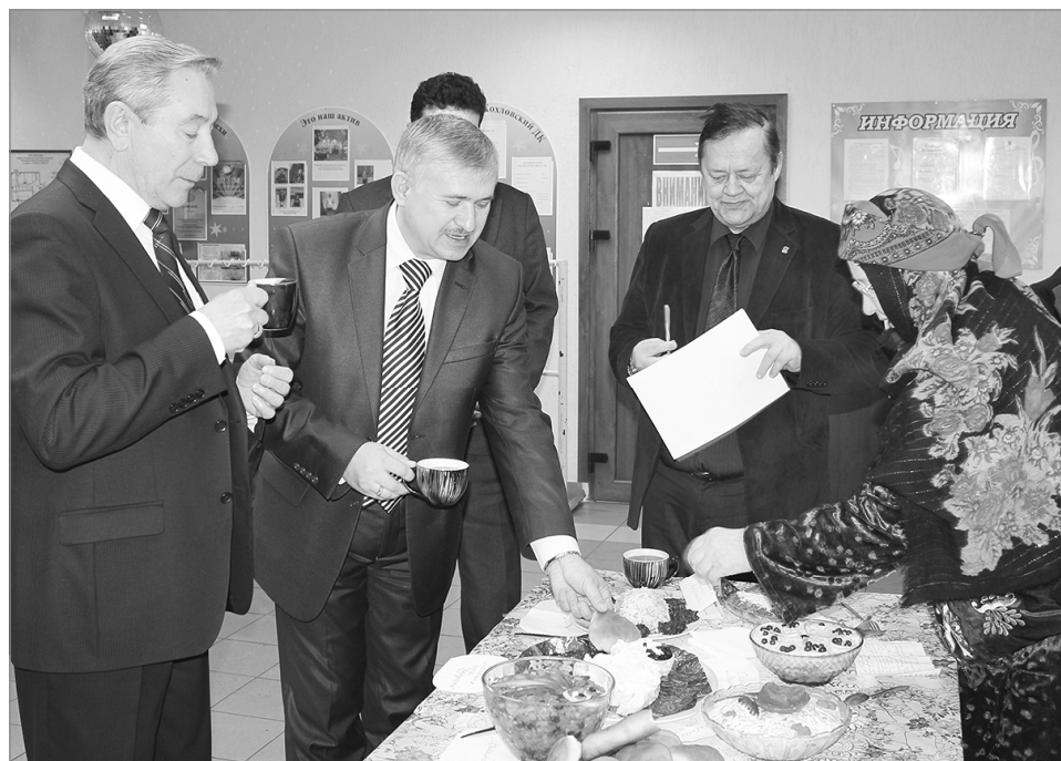
Вкусны пироги да салаты!