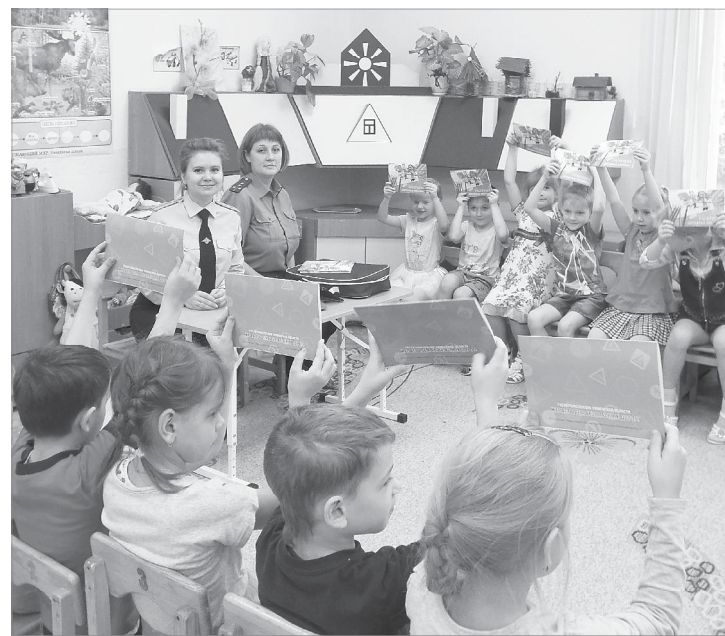
Учим правила, играя

Автоинспекторы же, обращаясь к взрослым, просят их самих не нарушать правила, особенно в присутствии детей, чтобы не разрушать тех знаний, которые дают им педагоги.